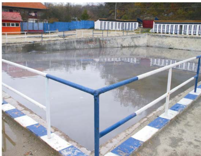
Bazin nr. 2