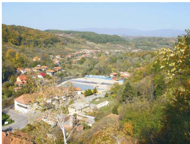
Centrul Stațiunii Săcelu

După 1989, stațiunea Săcelu a avut o perioadă de regres, ca urmare a revendicării terenurilor și imobilelor construite înainte de 1948. Începând cu anul 2000, bazinele cu izvoare minerale au fost mai bine întreținute, au apărut vile și pensiuni noi cu condiții moderne de cazare și tratament, existând perspectiva dezvoltării stațiunii în scop terapeutic și turistic.